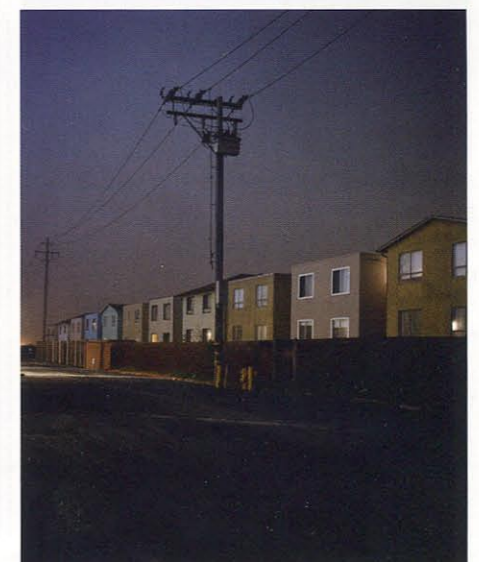
Kultur Todd Hido 2524_1999, Untitled 2524, 1999, C-Print, 75 x 95,5 cm