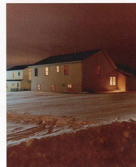
Untitled 2479-a, 1999, C-Print, 50 x 60 cm, © Todd Hido, Courtesy: Kaune, Sudendorf Gallery, Cologne