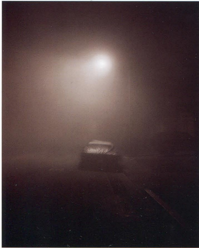
Untitled 1738, 2003, C-Print, 75 x 95,5 cm

Unter dem Titel „House Hunting/Nudes“ mit Fotoarbeiten des US-amerikanischen Künstlers Todd Hido präsentiert Gallery for Contemporary Photography, Kaune, Sudendorf GmbH, Köln, die erste Einzelausstellung des Künstlers in Westeuropa. Die ausgestellten Arbeiten sind eine Auswahl aus seinen Monografien „House Hunting“ und „Between the Two“.