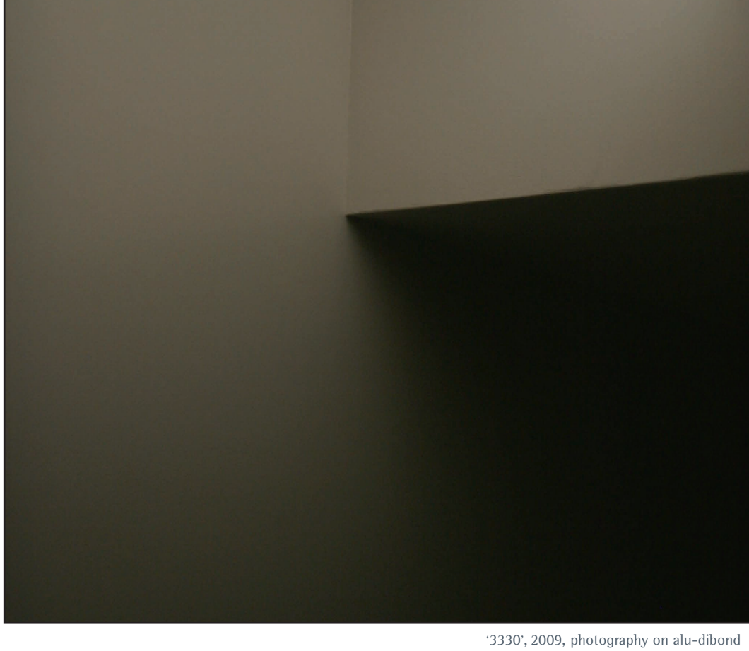
'3330', 2009, photography on alu-dibond

Die Konsequenz und Radikalität mit der Heyne sein Konzept verfolgt machen ihn zu einem Meister der Abstraktion. Sie sind bezeichnend für die ausgesprochene Qualität seiner Arbeit. So erscheint es logisch, dass mittlerweile nicht einmal mehr die Bildtitel einen Hinweis auf das Abgebildete geben. Heyne zeigt uns, dass die Welt nicht eindeutig ist. Er formuliert visuelle Fragen die den Horizont des Sichtbaren um die Komponente des Vorstellbaren erweitern.