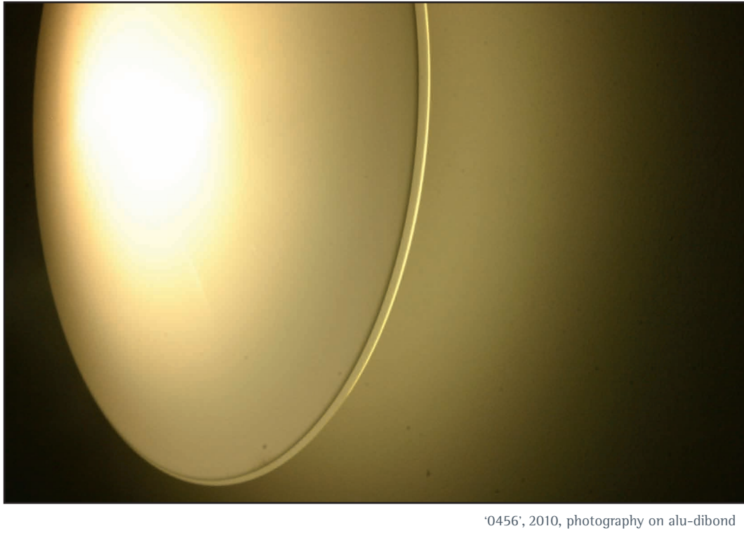
'0456', 2010, photography on alu-dibond