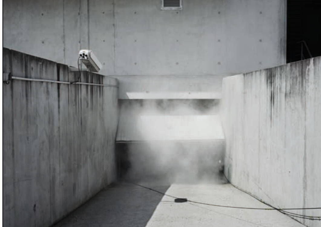
'Smoke #3b', from the tryptich ‚Smoke #3‘ 2009, Edition of 3

Diese zunächst deutlich spürbare Sinnlosigkeit entpuppt sich dennoch als große Sinn- und Wahrhaftigkeit im dankenswerten Auftrag der gesellschaftlichen Basiskonstitution. Wir sehen die blanke Realität zivilisatorischer Entwicklung, Übungsplätze für ‚Worst-Case-Szenarien‘ die täglich ebenso bespielt werden wie der Rest der Welt mit den realen Abläufen, deren Behandlung hier trainiert werden soll.