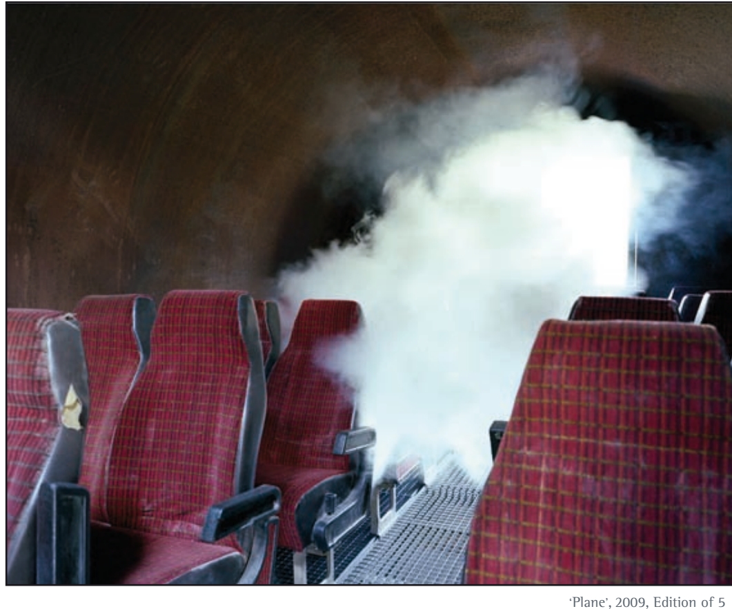
'Plane', 2009, Edition of 5